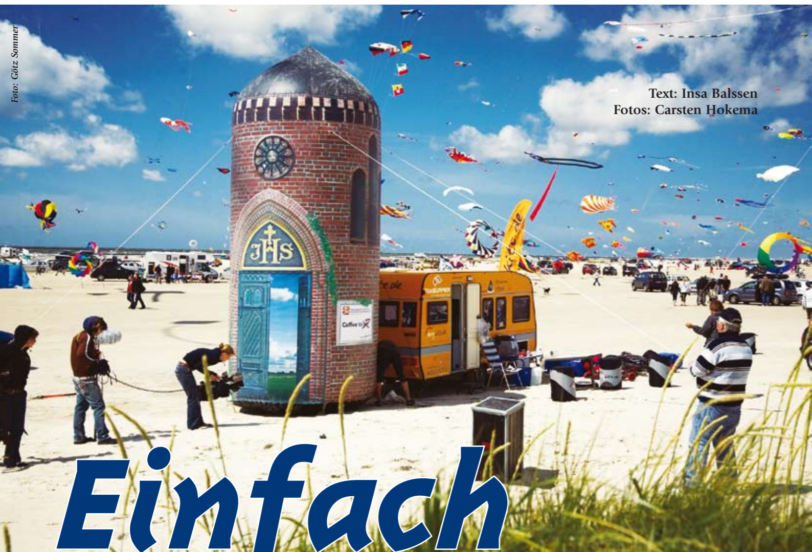
Text: Insa Balssen